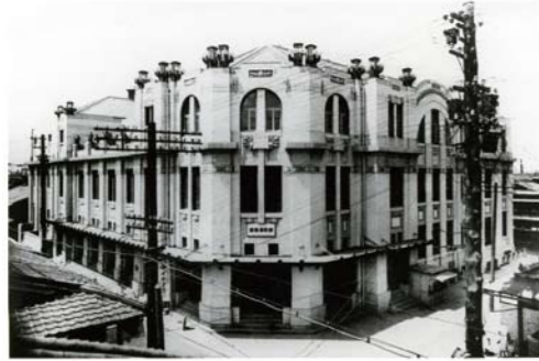
新町演舞場 (参照:「西六いまむかし」)

戦争で焼けるまで新町演舞場は新町廓の芸妓たちが踊りを披露した舞台であった。春の浪花踊は京都の都をどりと同じで、大阪の春を告げた。戦後、演舞場は書籍取次業の大坂屋となったが社屋の一部に演舞場の外観がそのまま残されている。新町演舞場はかつて高島座、そして新町座とい、木造の芝居小屋で新派劇発祥の地である。角藤定憲は21歳のとき旧派歌舞伎に対抗して新派を唱え、改良演劇として自由民権運動の政治批判の壮士芝居をここで演じてみせた(明治21年・1888)。明治の新興演劇は大阪の新町から起こったのである。