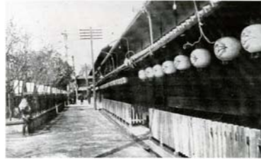
新町九軒桜と吉田屋 (参照:「西六いまむかし」)

秀吉が天下を統一して大坂に城を築き、大坂のまちの建設をはじめたころ、戦いに疲れて大坂に集まった武士たちに大坂の色里を公認した。これが遊郭の始まり。その後、大坂の夏の陣で崩落した大坂城を二代徳川秀忠が再建した。再建工事に集められた各藩の武士たちのために、風紀の乱れを案じた大坂城主平井忠明が散在する遊所を一か所に集めた。これが公認遊郭・新町の始まりである。起源は京都嶋原、江戸吉原よりも古いといわれる。江戸時代より各地の公認・非公認の遊所の比較が行われてきたが、新町は東の大関(最高位)であるという記録もある。このあたりは芦原の湿地帯で海へ水路が続いていた。西鶴の浮世草子、近松の浄瑠璃などにたびたび描かれ、多くの文人が訪れている。